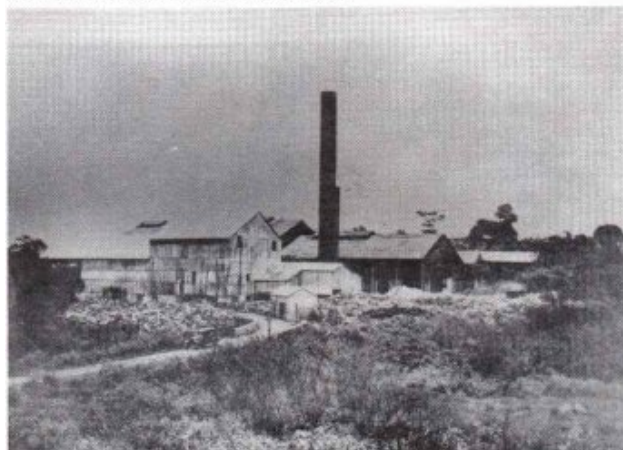
L'Usine Bonne-Mère des Sucreries Coloniales

Le même jour, une réunion entre usiniers, grévistes et le gouverneur. Les usiniers proposent une augmentation de 25 à 39% sur les salaires de 1929 : les délégués, considérant l'augmentation proposée insuffisante, la refusent.